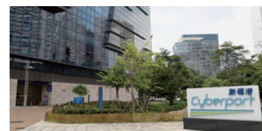
▲ 數碼港致力為數碼科技初創和企業家提供全面支援，並適時作出靈活應變。

疫情為社會各界帶來不同程度的危機，數碼港管理層對此作出靈活應變：如將每年3月的實體招聘博覽改以虛擬形式舉行，見證破紀錄的參與公司及