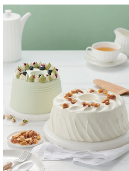
美心集團崇尚創意與可持續發展。

經過64年的發展，美心集團已成為具規模的餐飲集團，在港澳地區、內地、越南、柬埔寨、泰國、新加坡和馬來西亞擁有逾1,700間分店，業務範疇廣及中菜、亞洲菜、西餐、快餐、西餅、咖啡店、日式連鎖餐飲及機構餐務等；同時提供如月餅等一系列優質的應節食品，並獲得星巴克、元氣壽司及一風堂拉麵、The Cheesecake Factory、Shake Shack等國際知名品牌在不同地區的經營權。