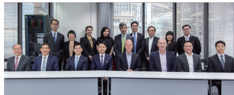
獎項的評判團及評審團由不同領域的專業管理精英及學術界代表組成，配合客觀公正的評審準則，以致獎項備受尊崇，其認受性不斷提升。

而得到優異獎的保誠保險有限公司，在評審心目中是重視人才的企業，除理財顧問人數屬業界之冠外，顧問團隊也獲保誠的多元化專業支援。至於獲得中型企業特別獎的3間公司，評審認為皆具備重視創新及人才發展等共同優勢。