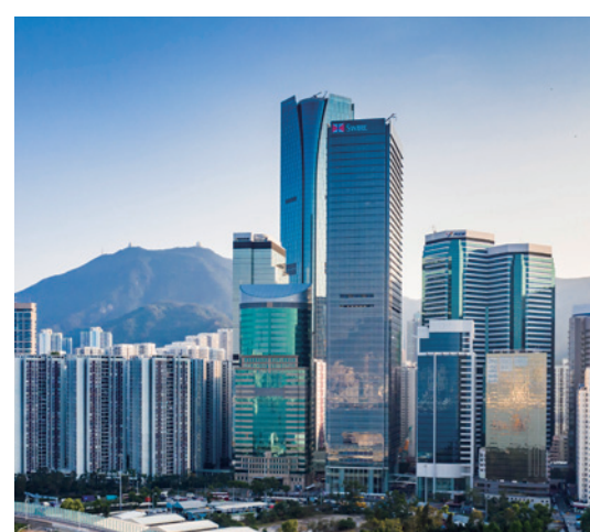
太古地產在營運上堅持以客及先及以人為本。

在以人為本方面，除提供互動創新平台及「卓越管理培訓計劃」等培訓項目，助員工掌握公司的核心價值，並提升領導才能外；太古地產更推出彈性工時安排及職場休假期計劃等靈活工作政策，更鼓勵同事提出改善流程的創意提案，以增強歸屬感。