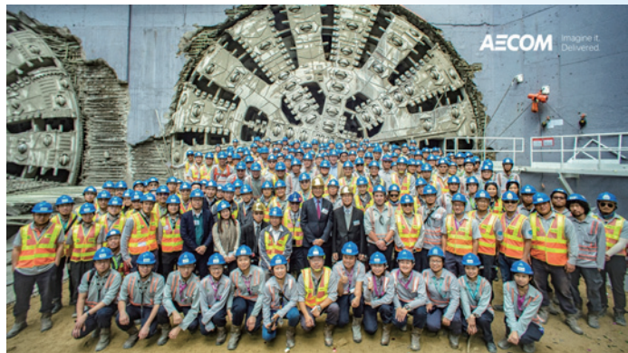
▲ AECOM擁有與公司目標一致的優質專業團隊，致力構築更美好的世界。

作為全球知名的工程顧問公司，AECOM Asia Co. Ltd (下稱AECOM) 秉承「安全、品質為先」的企業文化，藉制定明確的策略和目標，配合全方位的人才培訓，助員工掌握公司的核心價值。同時也幫助員工擴闊視野與知識領域，全面提升對品質的要求，使公司在管理層面上不斷精進，更於應屆「優質管理獎」中勇奪大獎。