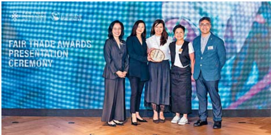
▲ 冠君產業信託獲得公平企業獎——最高級別的白金獎，肯定信託於可持續發展的承諾。