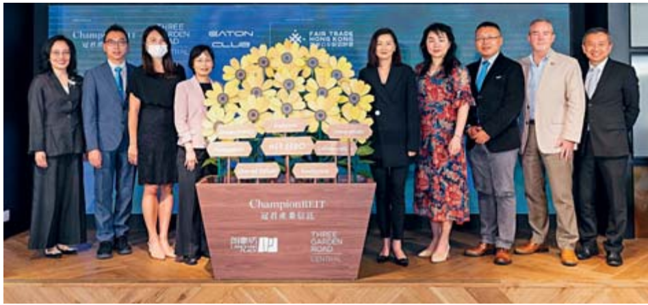
▲ 一眾嘉賓共同參與冠君產業信託「淨零排放」的啟動儀式。

冠君產業信託旗下物業花園道三號早前被香港綠色建築議會評為「綠建環評」白金級認證，除在七個評分項目中的五個類別，包括營運管理、場地、用材及廢物管理、能源使用、用水及創新 獲得滿分外，更獲頒「能源使用範疇最高分數獎」。連同WELL健康建築標準白金級認證，花園道三號成為全港少數獲得「雙白金」認證的建築。足見其物業一直致力透過推行創新舉措，提升技術及優化設施上可持續發展的努力備受肯定。展望未來，冠君產業信託將繼續與各方持份者緊密合作以發揮更大的影響力，共同推動綠色及健康環境。