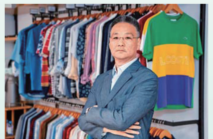
▲籌委會主席李國本博士

要部分。今屆「香港可持續發展大獎」一如以往，主要分為機構獎項和個人獎項兩大類別。大會從每個組別的香港傑出可持續發展企業獎機構中甄選出具有卓越成就的企業，以表揚企業對可持續發展作出重大的承諾，其他獎項則包括典範獎、傑出獎、卓越獎及特別獎等。所有獲獎者皆充分展現了如何把握可持續發展帶來的機遇，在賺取商業利益的同時為社會和環境作出貢獻。