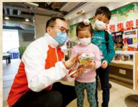
向居住於劏房和板間房及有特殊健康需要的兒童捐贈教學玩具

此外，集團與黃廷方慈善基金及香港創新基金從多方面支援社區應對疫情，包括向醫院管理局捐款及捐贈醫療物資，以及向有需要人士送贈營養飯盒、必需品及電腦等，與社區同心抗疫。