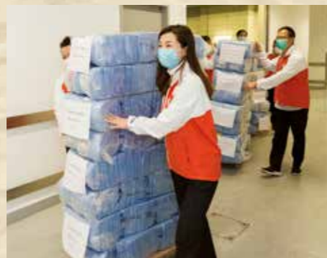
向醫院管理局捐款及捐贈醫療物資