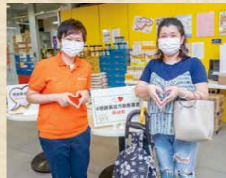
向基層家庭及少數族裔捐贈食物、熱食券及飲品等