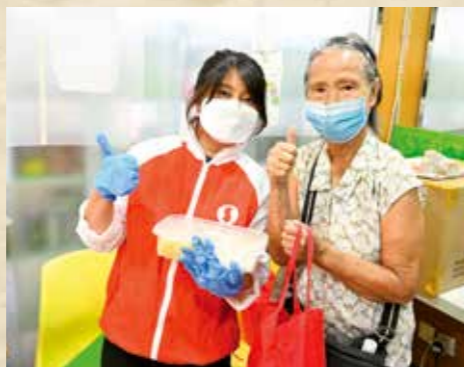
向有需要人士捐贈信和酒店營養餐盒